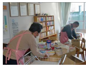
〈64 病棟の図書の整理〉