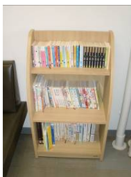
〈35 病棟の家族控室本棚〉