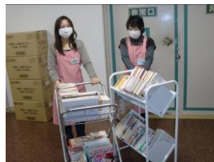
〈病棟へ図書の入れ替えに!〉

各病棟のデイルームや家族控室、7号館ラウンジコーナーに患者さま図書の本棚が設置されています。図書は患者さまや教職員からの寄贈で成り立っています。寄贈された図書は病院ボランティア室に届き、ボランティアさんによって消毒⇄分類⇄シール貼り⇄登録を行い、本棚へと並べられます。病棟へは月1回(第4週目)、病院ボランティアさんがワゴンに図書を積んで入れ替えを行ってくださっています。