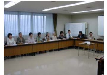
【木下病院長から200時間表彰です】【活動時間100時間表彰者は12名】