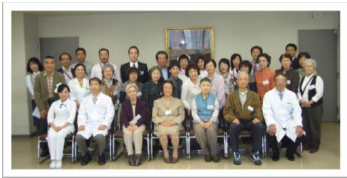
【参加者全員の記念撮影(*^_^*) 良い笑顔でパチリ♪】