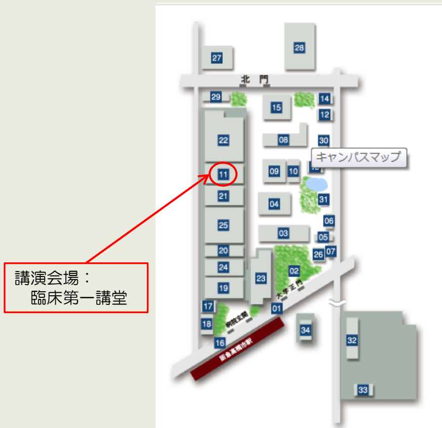
大阪医科大学附属病院