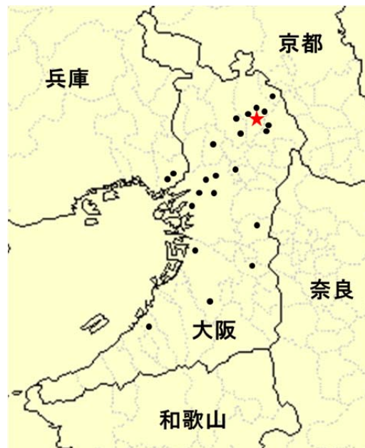
大阪医科大学眼科学教室 関連施設の分布図 (●関連施設)